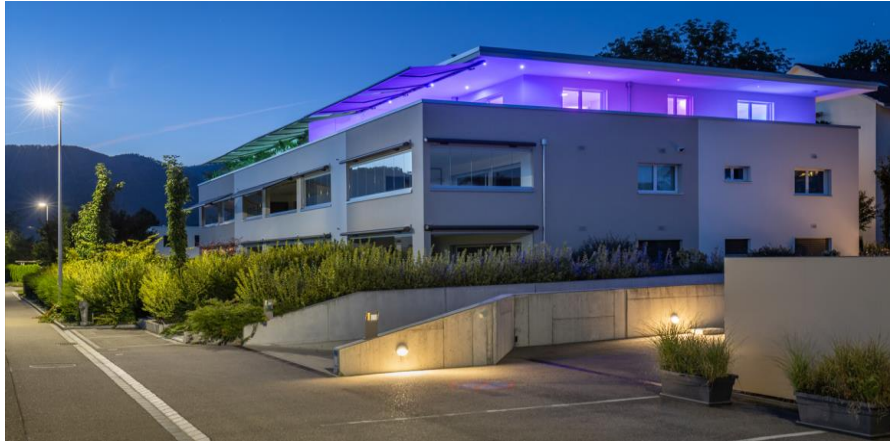
WESTFIELD Mehrfamilienhaus Härkingen